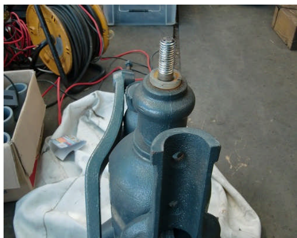
ロッドヘッドを外した状態