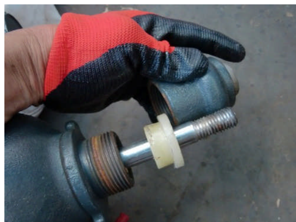
グランドボックスを緩める