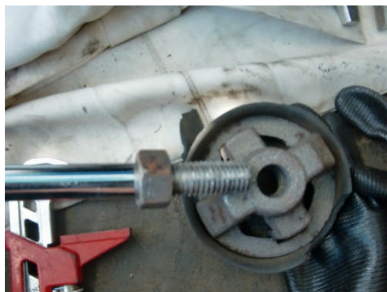
ピストンを分解して清掃する。ゴムの交換します。