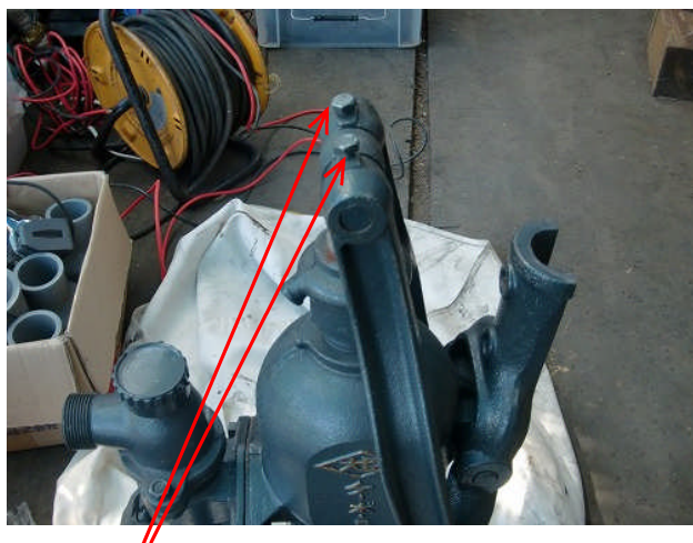
ロッドヘッドのボルトを緩め、ピンを抜く